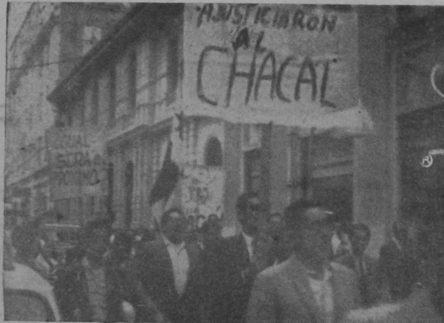
AJUSTICIARON AL CHACAL— Así rezaba un rótulo portado por un estudiante del Instituto Internacional de Educación Política en desfile que realizaron por la Avenida Central a eso de las 5.30 de la tarde, cuando nuestro teletipo confirmaba la muerte del asqueroso dictador. Había alegría en el rostro de todas las gentes.

Atentamente, JUAN BOSCH Presidente del Partido Revolucionario Dominicano San José de Costa Rica, 31 de mayo de 1961.—