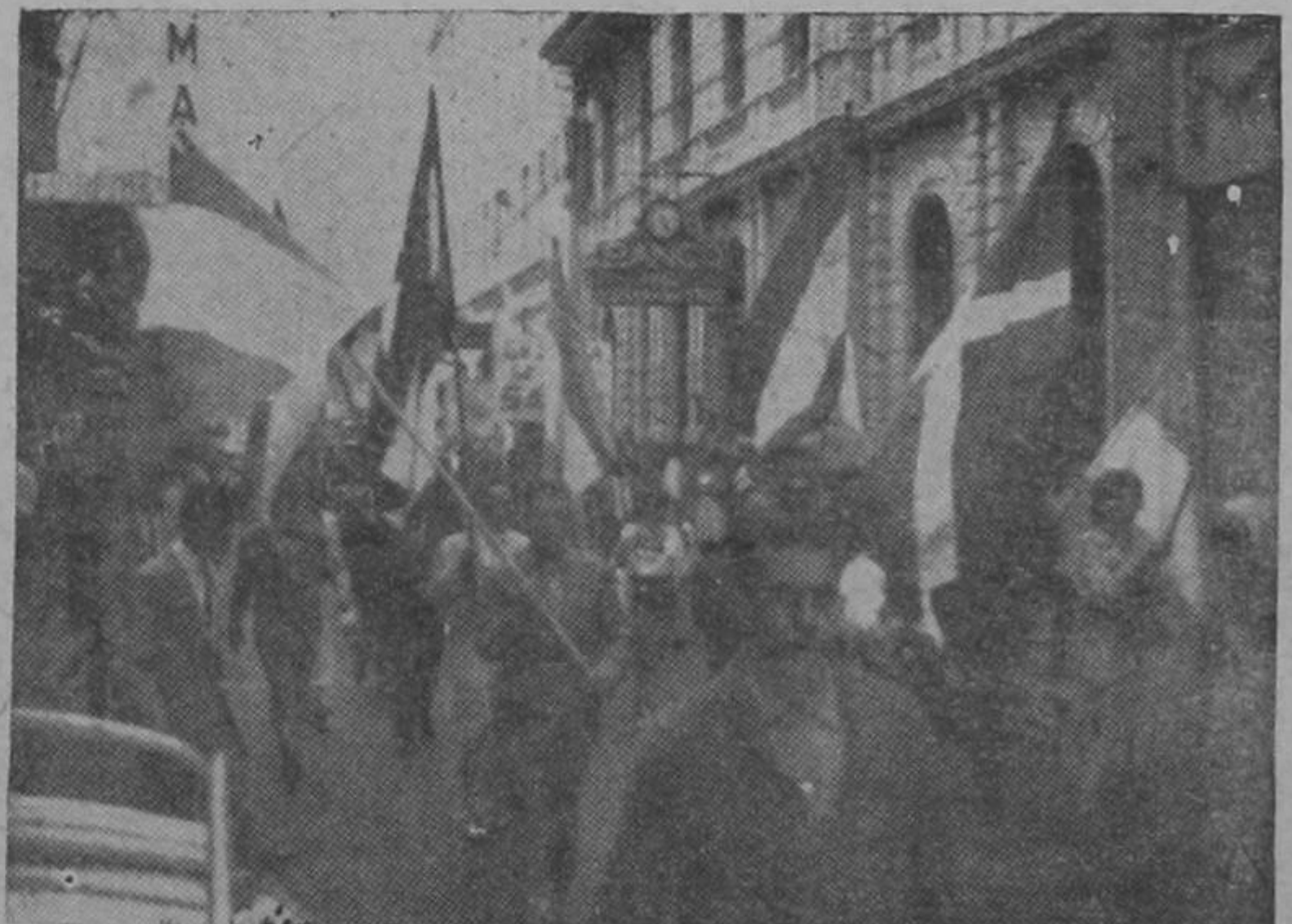
Los estudiantes del Instituto Internacional de Educación Política desfilan por la Avenida Central hacia el Parque Central, donde pronunciaron sendos discursos al Ex-Presidente Figueres y el líder dominicano Juan Bosch. Las 20 banderas de la América Hispana flameaban libres al viento, como en señal de regocijo. El aire que las movía no tenía ya la contaminación liberticida de la bestia ajusticiada.