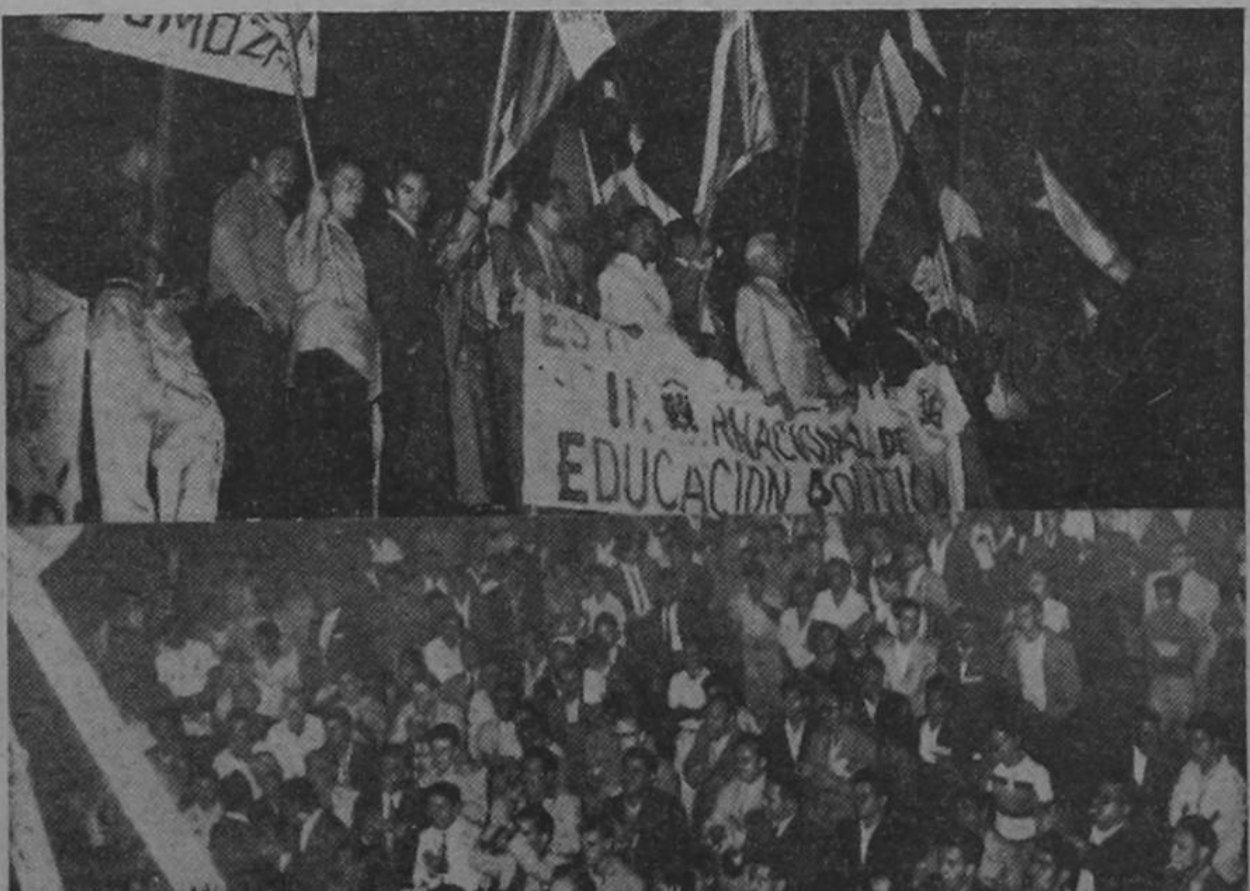
En el Parque Central, una gran concentración de estudiantes del Instituto Internacional de Educación Política y público en general. Arriba, el líder dominicano Juan Bosch le dirige la palabra.— Vibrante y emocionada voz la de don Juan Bosch, que durante varias décadas ha permanecido en el exilio en medio de grandes sacrificios personales y de su familia, como muchos otros dominicanos dignos, luchando por sus ideales. Pero al fin se hizo justicia en América. Y el chacal maloliente que infestaba los aires de este continente de libertad, ya no pertenece al mundo de los vivos... HA SIDO AJUSTICIADO.

En el Ministerio se informó que los giros de este mes no entregados, posiblemente se entregarían a fines de la semana próxima. — (TEXTO EN PAGINA 3) —